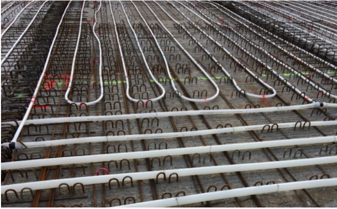
Betonkernaktivierung auf der S-dec® bauseits verlegt

Auch das Verlegen einer Betonkernaktivierung auf der S-dec® gestaltet sich erheblich einfacher als bei herkömmlichen Deckensystemen mit Gitterträgern. Nahezu konfliktfrei können die Rohre in jeder Richtung verlegt werden.