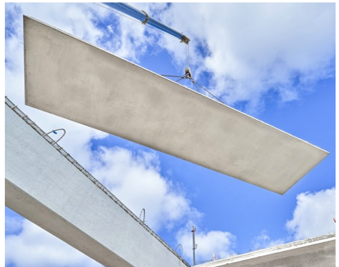
Montage einer Großformatplatte