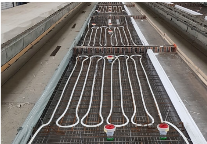
Betonkernaktivierung im Werk direkt eingebaut

Bei frühzeitiger Planung und Abstimmung der Haustechnikwerke können die BKT-Module auch schon im Werk unmittelbar in die Elementplatte eingebaut werden.