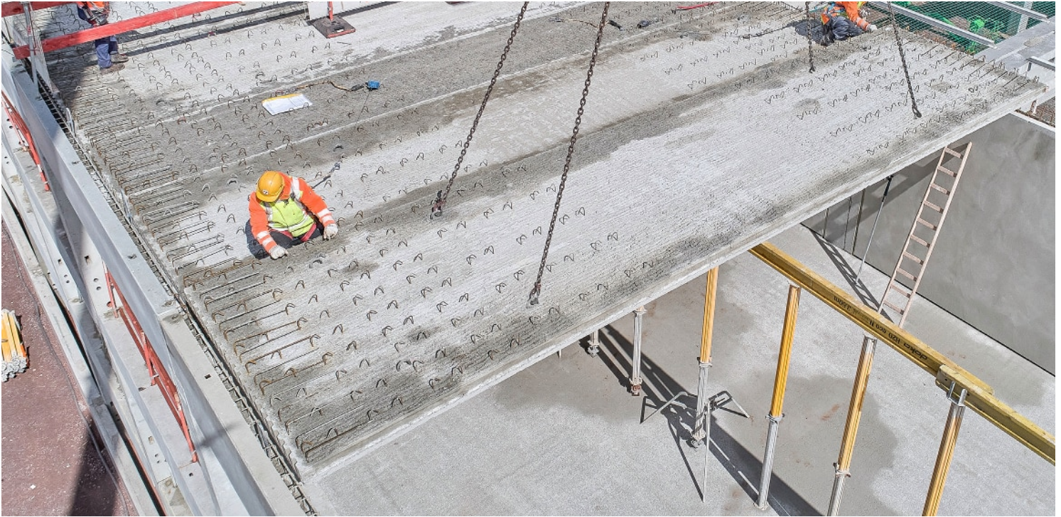
Montage bis 12 m mit Mittelunterstützung im Bauzustand